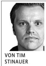
VON TIM STINAUER

Sie machen wach, sie machen stark, sie machen glücklich – und sie machen noch nicht mal arm. Aber sie machen krank. Sehr krank. Synthetische Drogen, die zunehmend den deutschen Markt überschwemmen.